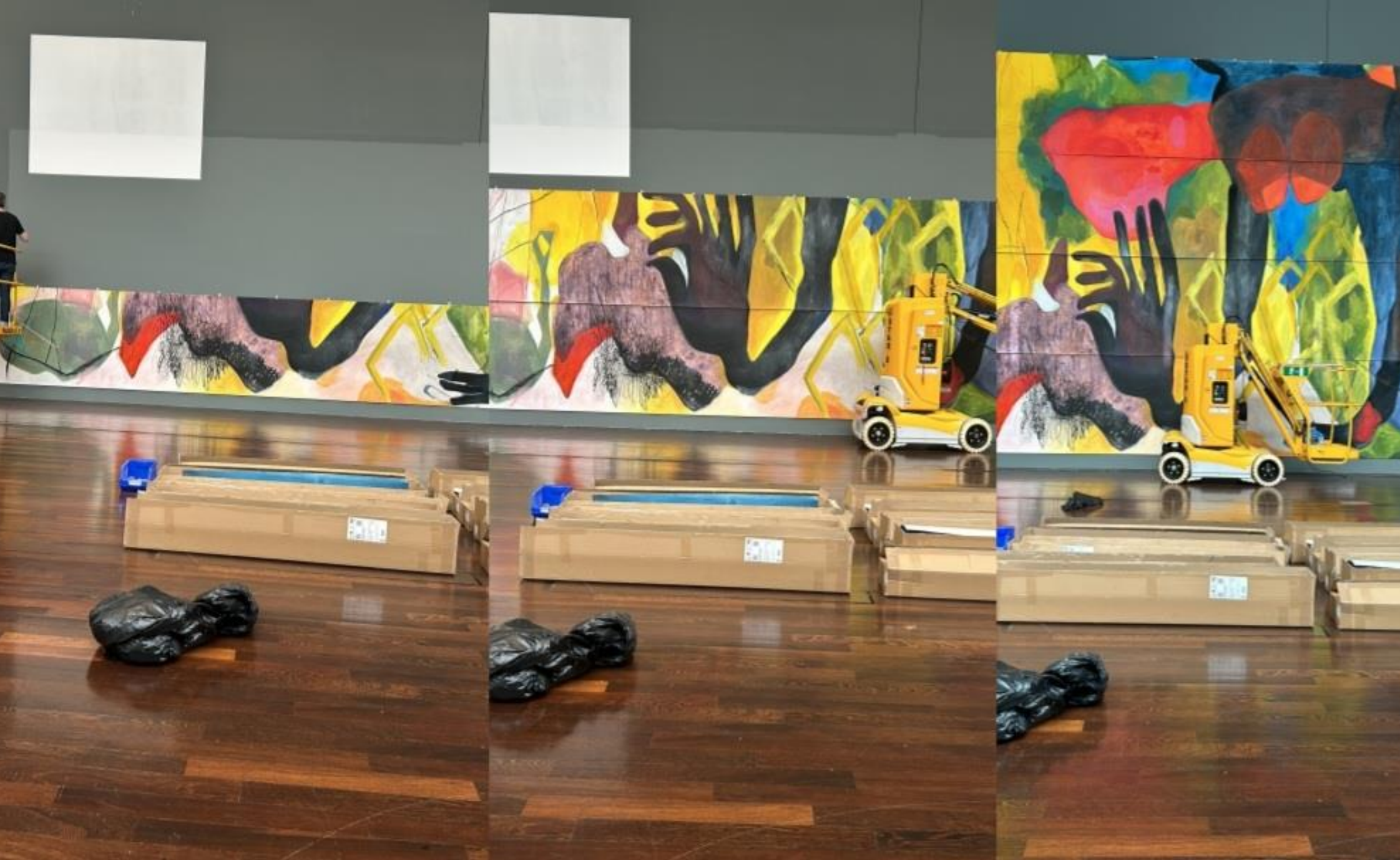
Vista de montaje